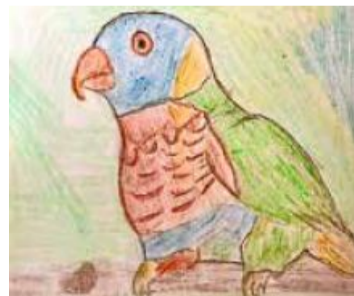
ZEICHNUNG MELINA HUTZMANN (6. KLASSE)

Loris oder Honigpapageien, wie sie auch genannt werden, sind mittelgrosse, farbenprächtige Papageien. Ihre Besonderheit ist ihre Ernährungsweise, denn sie ernähren sich hauptsächlich von Pollen, Nektar und weichen Früchten. Der Honigpapagei nimmt seine Nahrung durch kleine Erhebungen auf der Zunge (Papillen) auf, welche sich wie ein Schwamm mit Nektar vollsaugen.