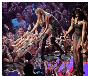
Taylor Swift live.

Auch im Internet ist Taylor Swift ein grosses Thema. Viele Menschen schauen ihre Videos, lernen Tänze oder teilen