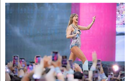
Taylor Swift im Letzigrund.