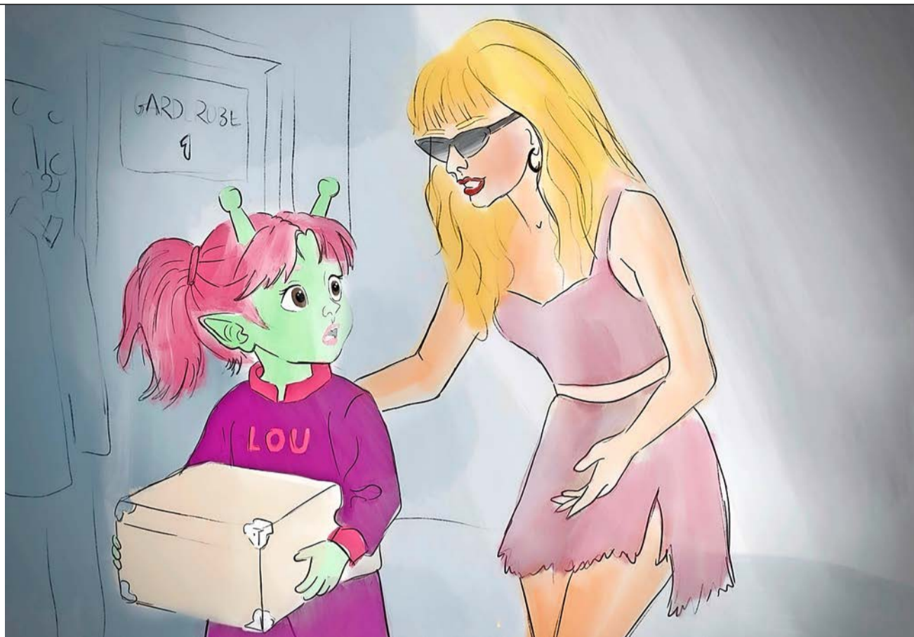
Zeitreisende Lou landet backstage bei Taylor Swift.