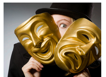
Damals übernahmen Jungen die Frauenrollen auf der Bühne.

Kannst du das Rätsel lösen? Sende die Lösung an lou@phsh.ch und gewinne mit etwas Glück das Buch «Romeo und Julia». Viel Erfolg!