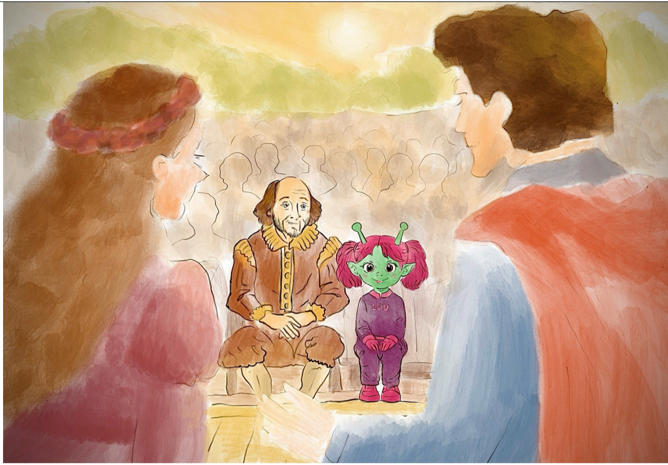
Lou und Shakespeare beim Freilichttheater.