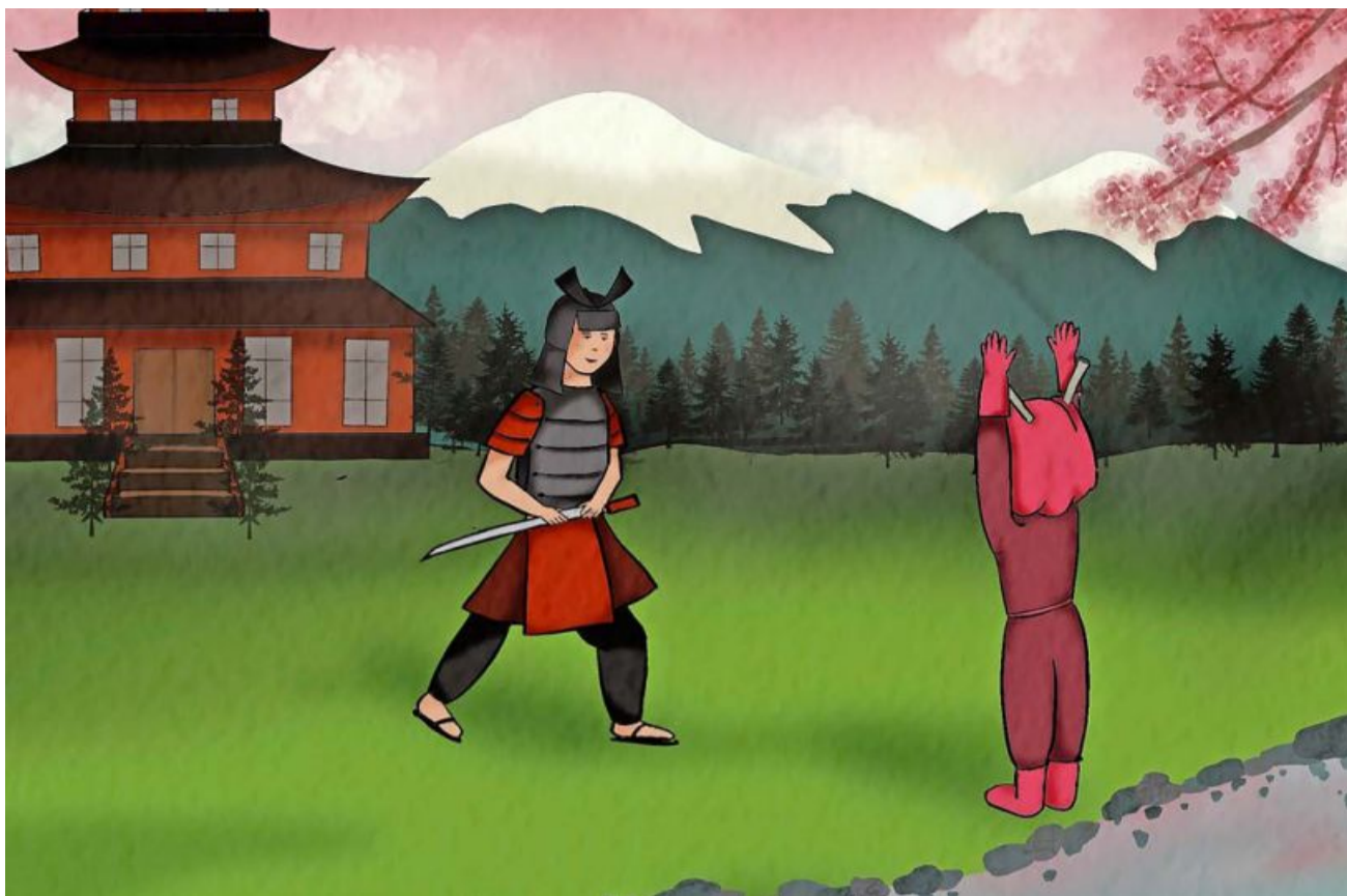
Bei diesem Besuch lieber nicht zu schnell reagieren und die Hände hochhalten, es könnte vielleicht gefährlich werden!